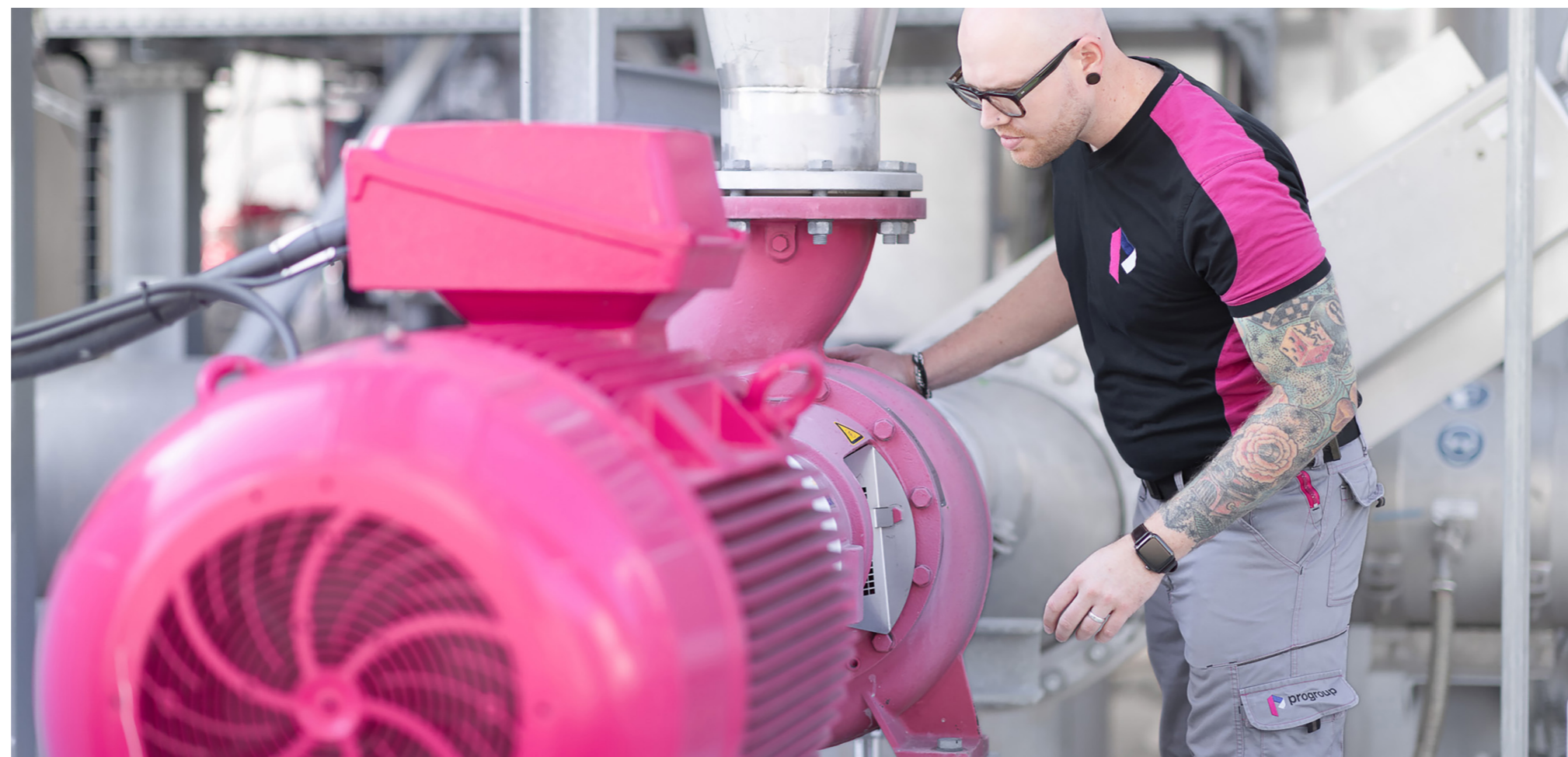
Maschinenkontrolle in einem Progroup-Werk