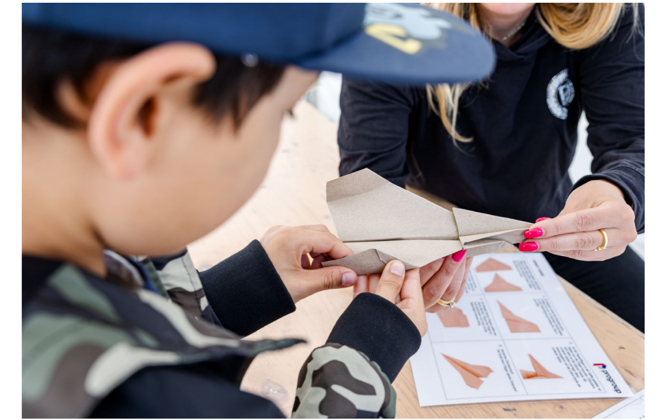
Papier ist auch für Kinder faszinierend.