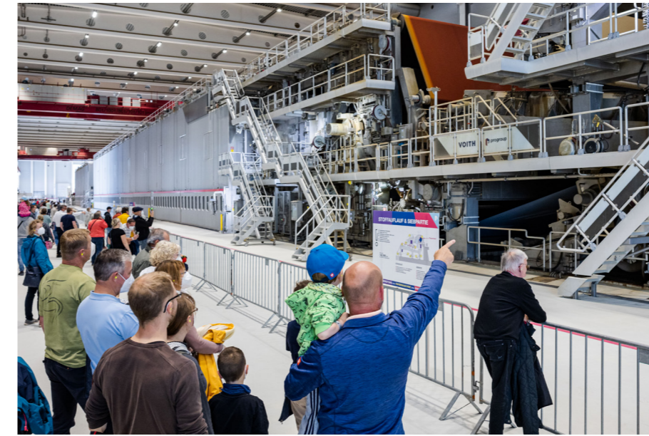
Tag der offenen Tür in einer unserer Papierfabriken