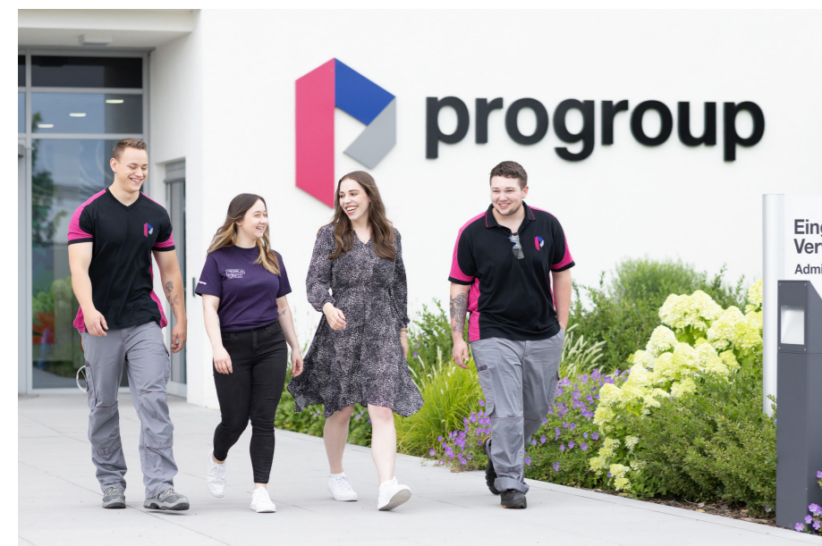
Progroup bietet jungen Menschen einen optimalen Start ins Berufsleben.